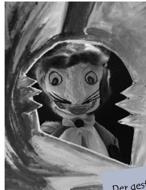
Der gestiefelte Kater

„Schnödendriesel Prasselgrun – Was läuft dort im Wald herum? Drieselgrun Schödenprassel – Ach, es ist ´ne Kellerassel. Prasseldriesel Grunenschnöd – Ei, wie bin ich doch so blöd! Schnödengrun Prasseldriesel – Ach, es war ein Maulwurfswiesel.“