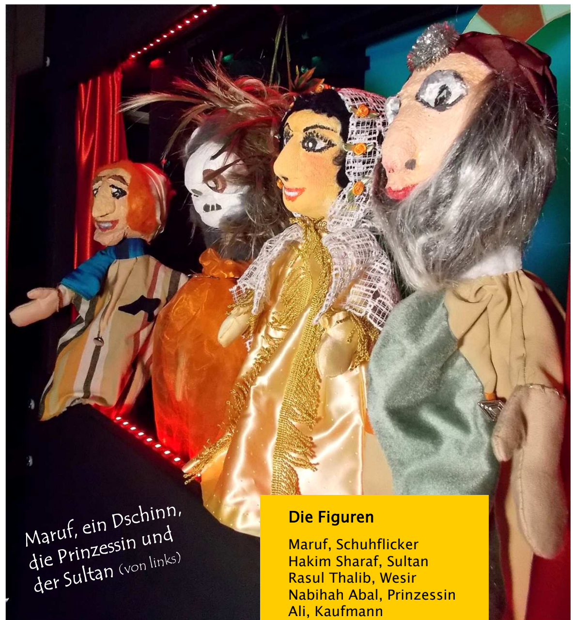
Maruf, ein Dschinn, die Prinzessin und der Sultan (von links)